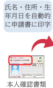
氏名・住所・生年月日を自動的に申請書に印字 本人確認書類