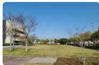
増築庁舎の建設が予定されている市役所裏

答 増築庁舎のこども家庭センターは、建設場所や施設の目的、建物規模が明確で、部屋の種類や配置などは利用者の声を聞いている担当職員が最も把握していることから、各担当課が集まり施設の内容を協議検討しています。これにより基本構想と基本設計となる資料を準備し、実施設計となる基本図面を建設部局で作成しています。