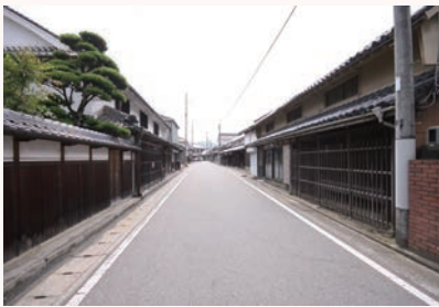
①国登録文化財「水田家住宅」付近 （旧丹波街道の古いまちなみ）