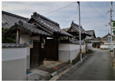
②西岸寺前 （寺町通りのまちなみ）