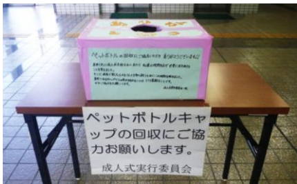
▲市役所1階に設置の回収箱(1月6日まで) ※北条鉄道・北条町駅にも設置しています。

貧困に苦しむ世界子どもたちへの支援活動につなげるため、成人式当日に会場へペットボトルのキャップをお持ちよりください。