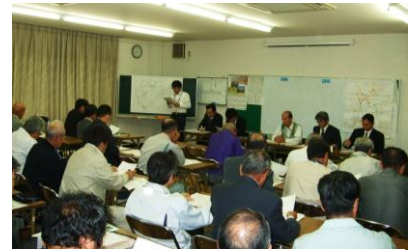
▲宇仁小学校での地元説明会の様子

また、11月16日に西在田小学校、11月18日に富田小学校の木造校舎の耐震化について、今後改築か、耐震補強を行うのかの方針について地元協議を行いました。その結果、全員一致で両校とも改築の方針を進めることを確認しました。