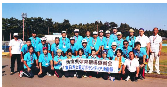
▲ボランティアに参加されたスポーツ推進委員の皆さん

この活動は、生涯スポーツ振興において深い知識と指導経験を有する兵庫県内スポーツ推進委員有志が被災地を訪ね、軽運動及びスポーツの機会を提供し、被災者の心身の健康保持に向けた支援活動を行うのが目的です。