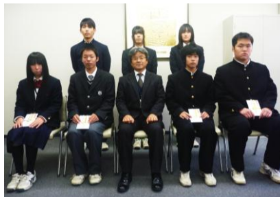
▲賞賜金交付を受けた皆さんと教育長(下段中央)